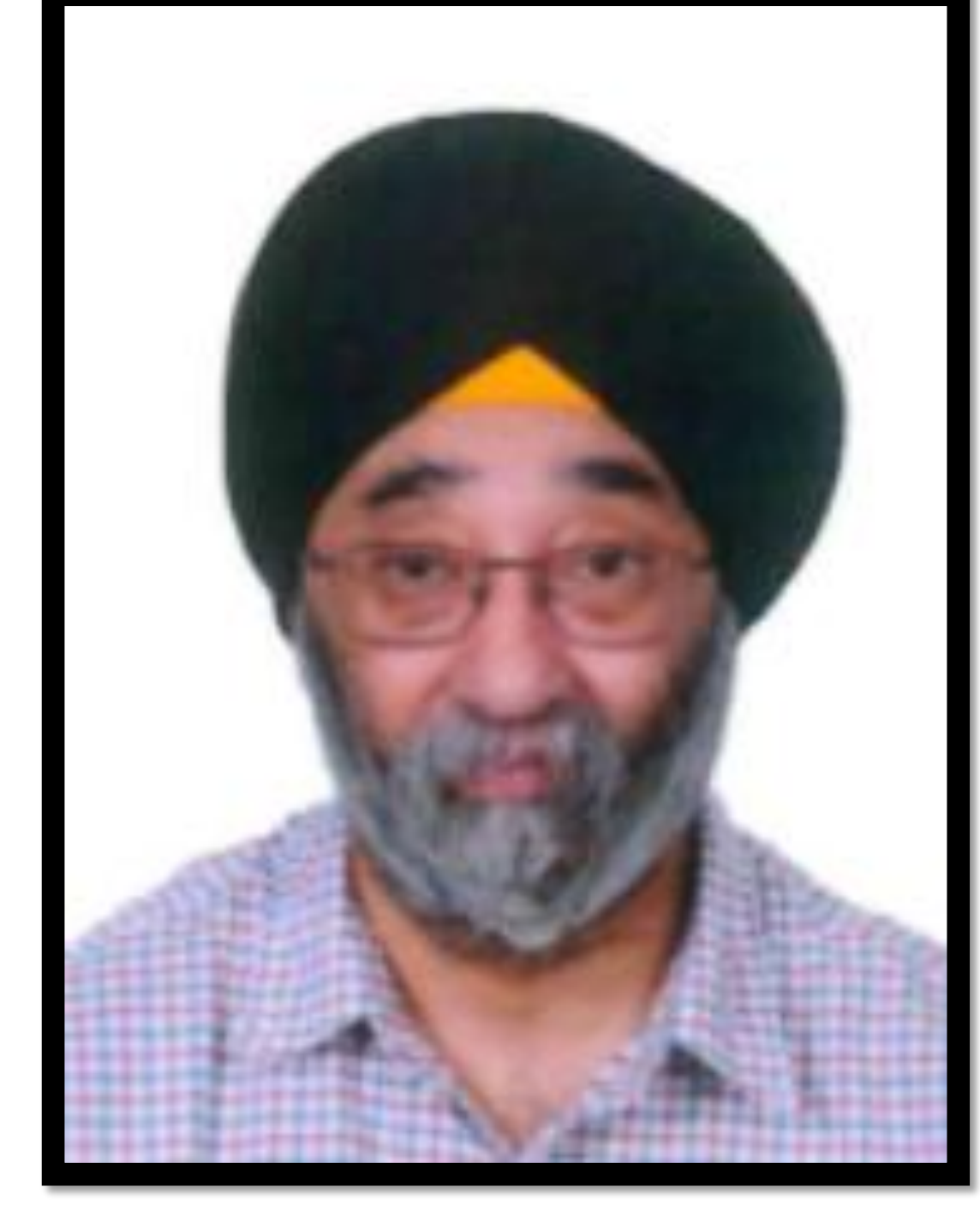
Sardar Baldev Singh